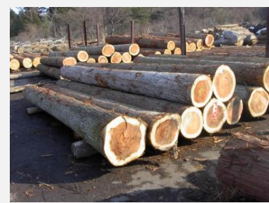
まっしま自然素材の家づくりネットワークの供給体制