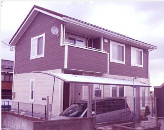
仙台市泉区 A 様邸 長期優良住宅