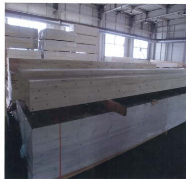
『みやぎの幸せの家』の地域型復興住宅供給体制