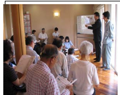
住まい方セミナーの様子