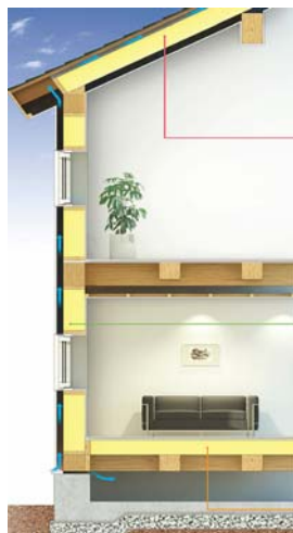
筋かいと一体の断熱壁