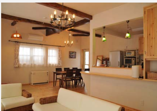
リビングダイニングキッチン