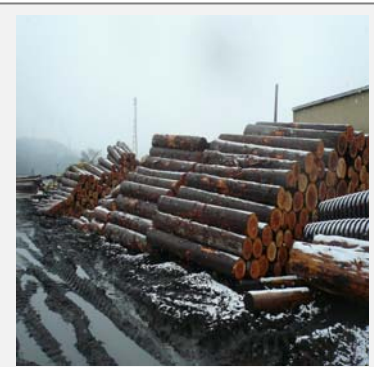
ハウスメイクグループの生産・流通ネットワーク