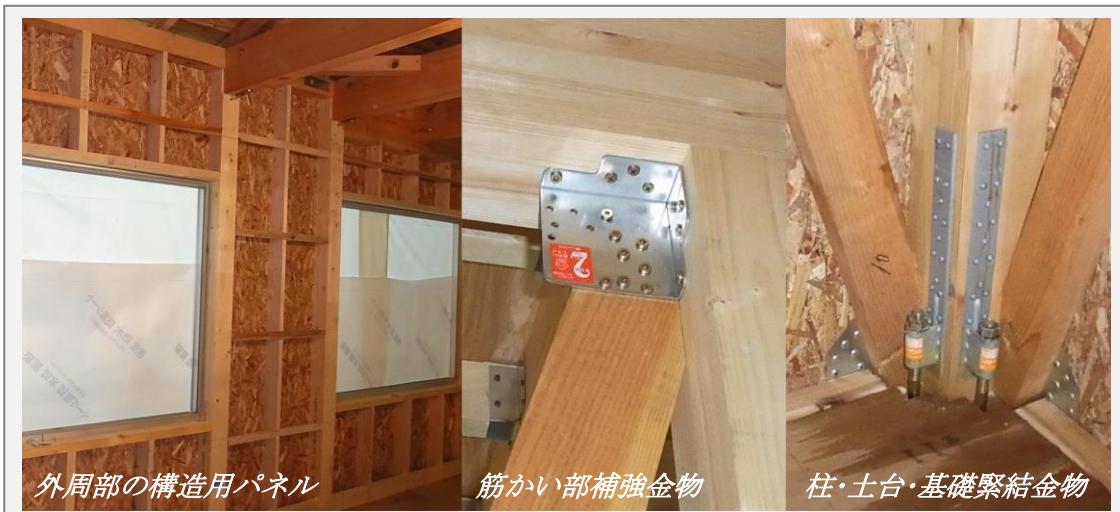
外周部の構造用パネル