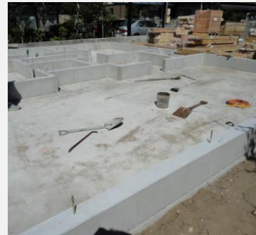
地域住宅生産者グループ・ネットワークの里 生産体制